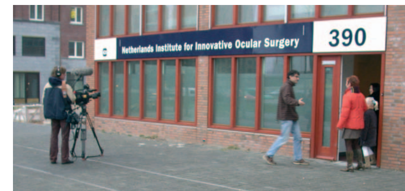
TV Tokyo maakt opnames voor het nieuwe NIIOS pand, voorafgaand aan een interview met een operatiepatiënt.

Voor het NIIOS is het erg dankbaar dat inmiddels door vele, merendeels buitenlandse collega's, dezelfde superieure resultaten na PLK worden beschreven. Wereldwijd wordt de effectiviteit van de PLK bevestigd en vraagt men zich af of een conventionele transplantatie bij endotheel aandoeningen nog wel medisch ethisch verantwoord is gezien de problemen waarmee men een patiënt opzadelt.